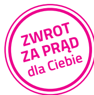
Tabele ofert oraz wysokości Bonusów dla Klientów i/albo Przyszłych Klientów Organizatora Programu od 1.12.2019 r.

Program kliencki – oferta partnerska i specjalistyczna z Bonusem